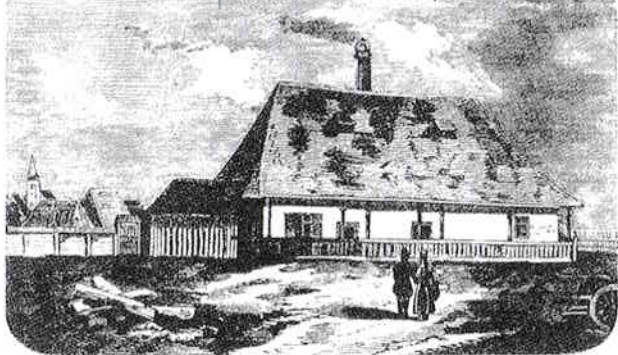
Cserei Mihály szülőháza Csíkrákoson (1860 körül)